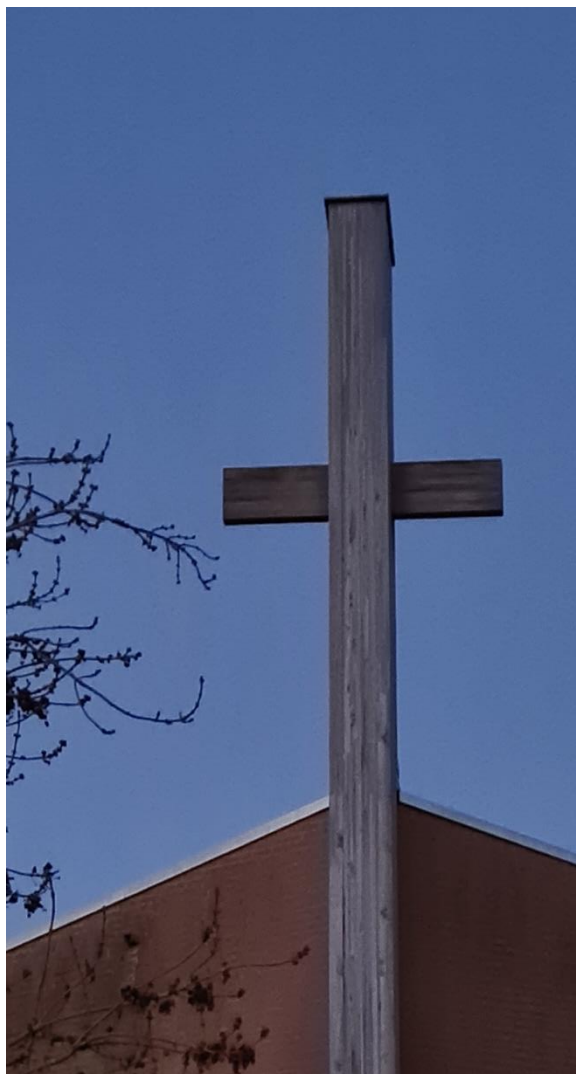
Foto van vlak na de dienst