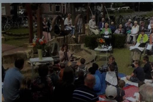
Viering 25 juni 2017 in Kloosterplantsoen

Als u meer wilt weten, neem gerust contact met hen op of neem een kijkje op onze website: www.pgij.nl .