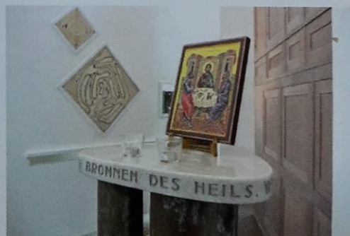
Stiltecentrum in de Ontmoetingskerk